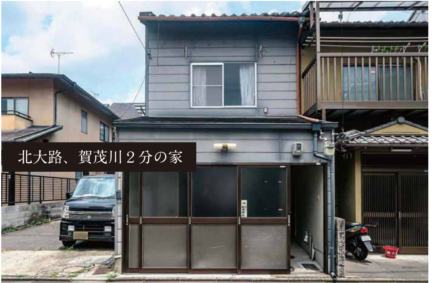
北大路、賀茂川 2 分の家