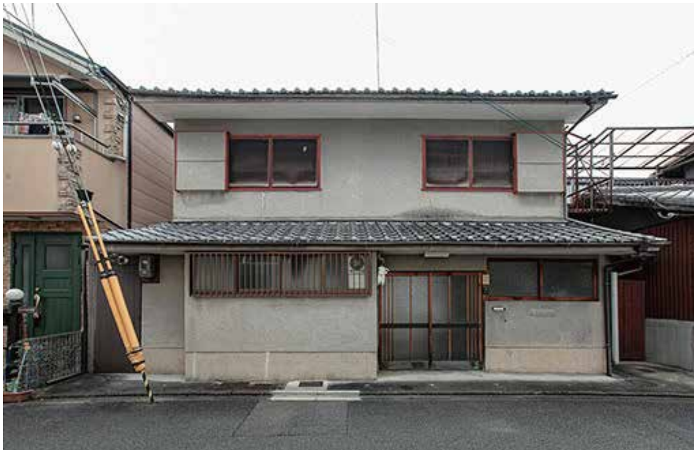
寺町今出川上る 鶴山町の家